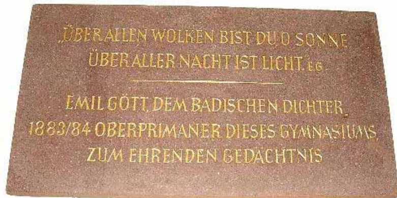
Foto der Gedenktafel in unserem Schulhaus