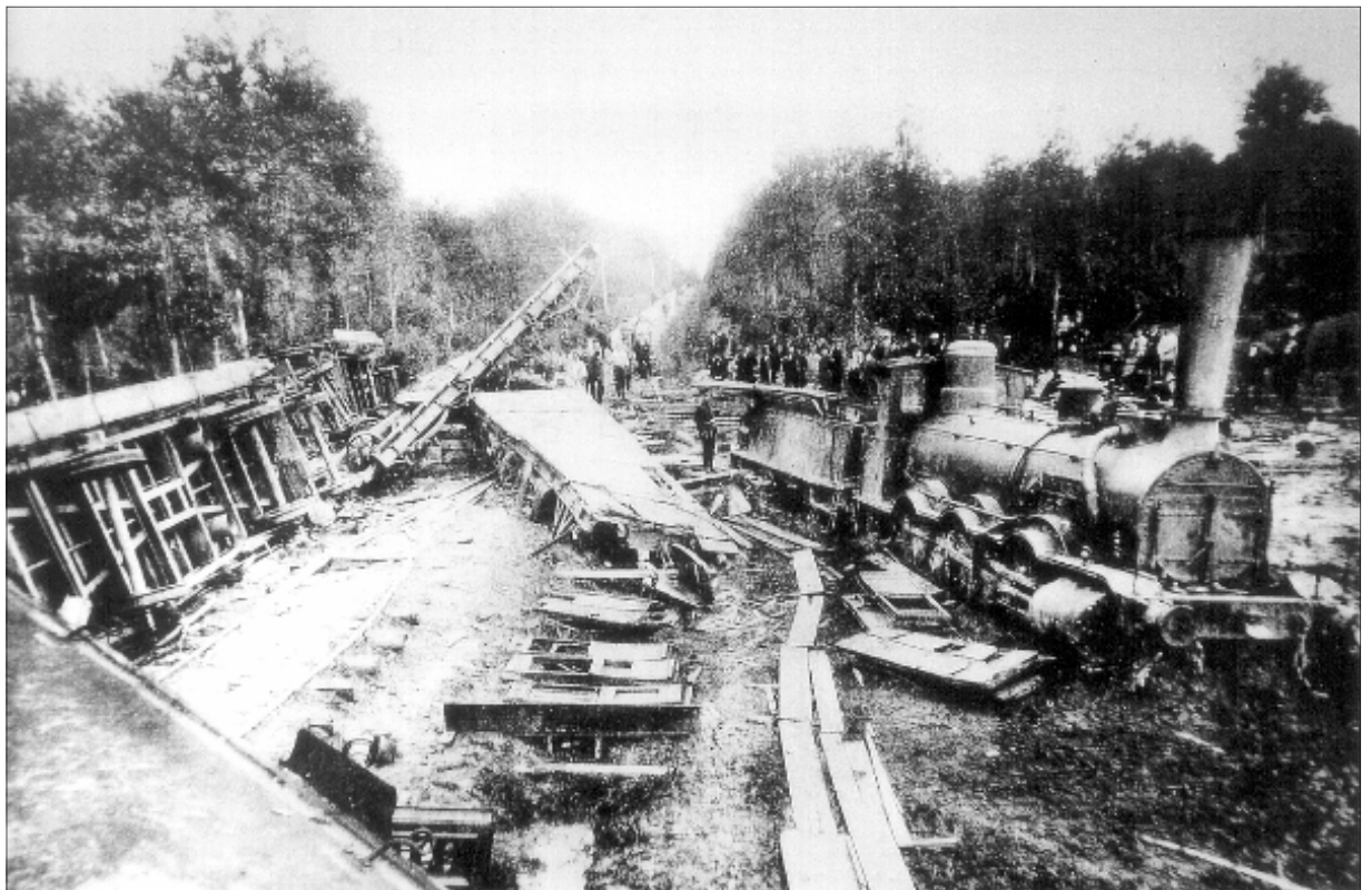
Das schwere Eisenbahnunglück bei Freiburg am 3.9.1882

Der gleiche Gymnasiast, für dessen späteres soziales Engagement dieser oben geschilderte spontane und selbstlose Einsatz eine frühe Vorankündigung war, gilt als äußerst verbummelter Schüler, dem die Schulzeit inzwischen zur Qual geworden war, der ein